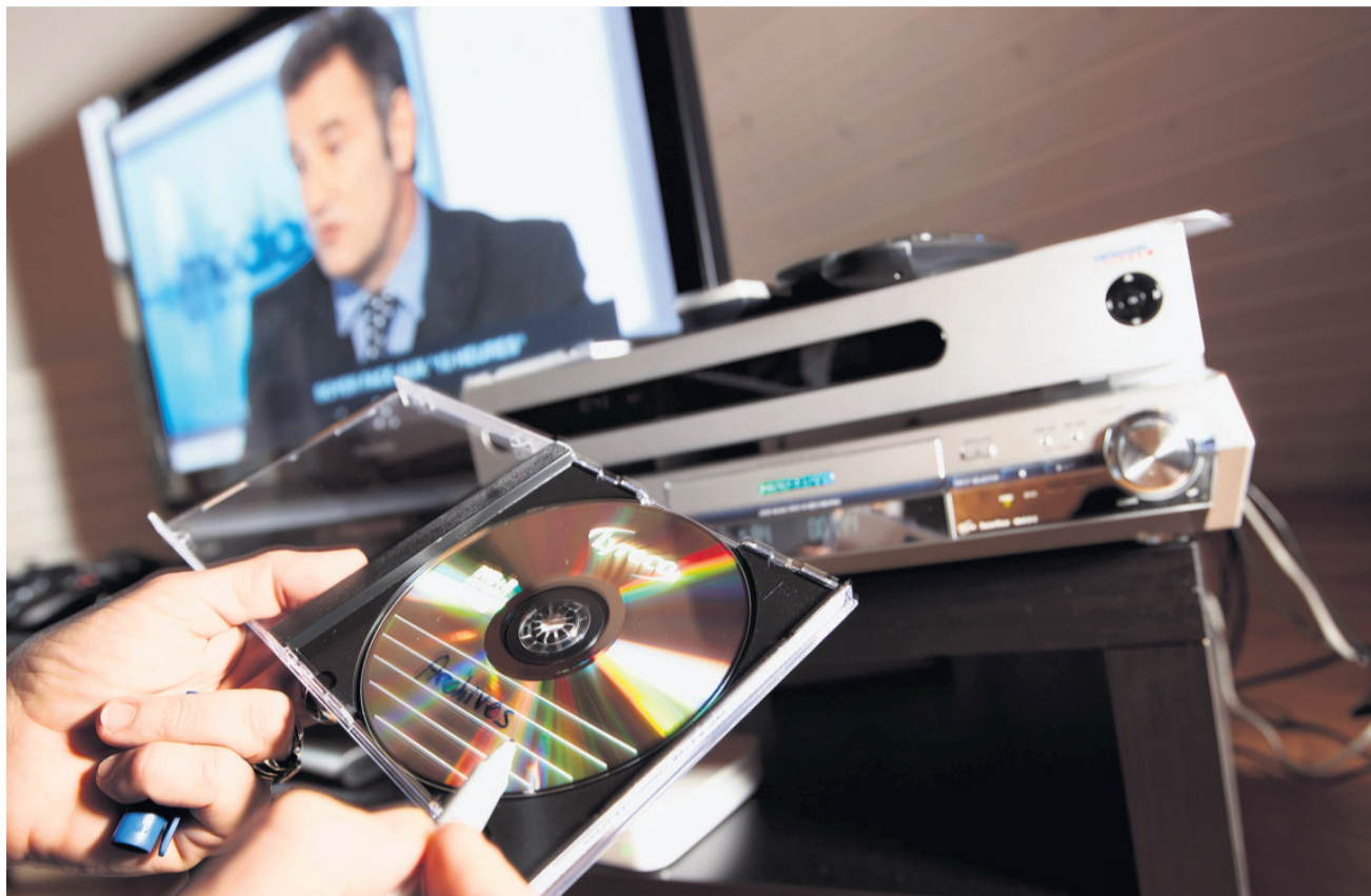
Pour ne plus risquer de perdre des enregistrements stockés sur un boîtier numérique, le truc est de les copier par péritel ou câble audio-vidéo sur un enregistreur à disque dur, pour ensuite les graver sur DVD.

Or, on voudrait parfois conserver certains documentaires exceptionnels. Il vaut mieux y penser à temps, car lorsqu'un boîtier numérique rend l'âme – cela arrive à toute machine – tous les enregistrements sont perdus. Le problème se pose aussi lors-